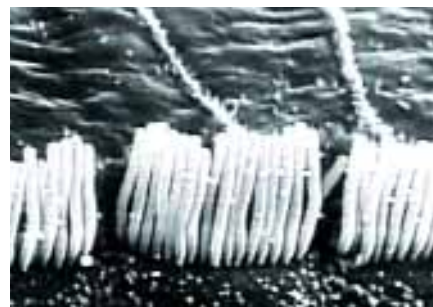
Ép szőrsejtetek mikroszkóp alatt

Bármelyiket is részesíti előnyben, mindig biztos lehet abban, hogy az MSA megvédi a hallását, a vadászokkal és lövészekkel együttműködve szerzett több mint 20 éves termékfejlesztési tapasztalatának köszönhetően.