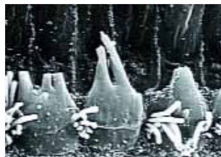
Látható halláskárosodás: sérült szőrsejtetek mikroszkóp alatt